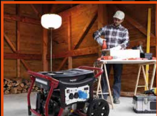
FAI DA TE